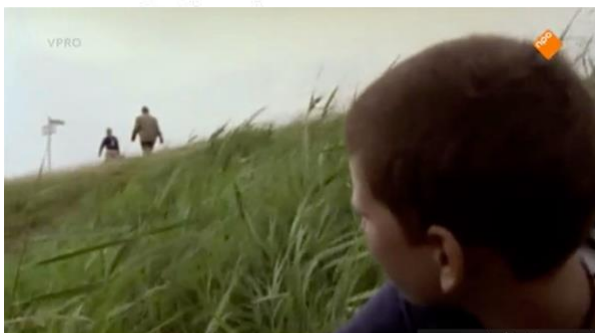
over de schouder